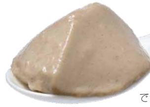
できあがりイメージ