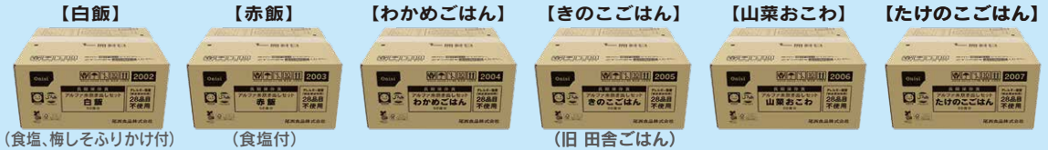
(食塩、梅しそふりかけ付)

この枠内は、 アレルギー物質(特定原 材料等)28 品目不使用であると同時に、NPO 法人日本アジアハラル協会より ハラル認証を取得した商品。