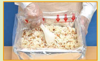
できあがりイメージ(写真は五目ごはんです)